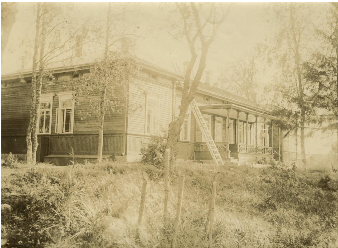
Mäntsälän uusi pappila noin vuonna 1900.